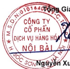
Nguyễn Xuân Phúc